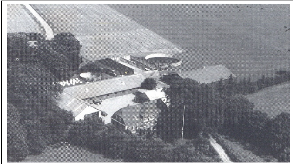
”Lykkesgård” 1990 Gården er godt rustet til at klare fremtidens krav og det smukke stuehus er meget velholdt.