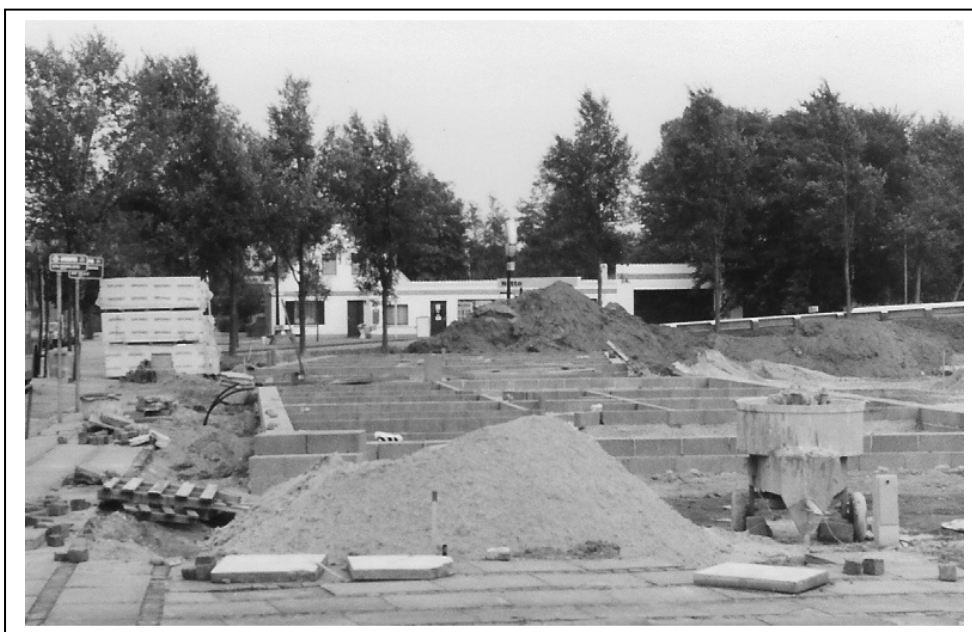
I 1988 gjorde bygningerne plads for nye pensionistboliger.

En epoke er slut, Købmandsgården bestod i næsten 100 år og vi har mange dejlige år at tænke tilbage på.