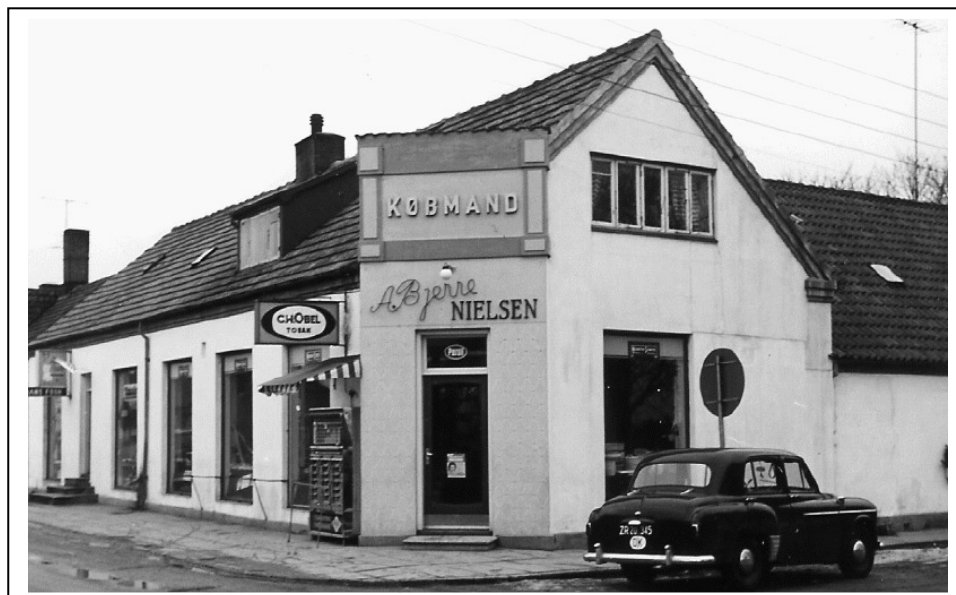
Købmandsgården, med udendørs automat. Først i træsserne.

Tiderne skifter, der kommer nye salgsmetoder og hen ad vejen moderniserede vi, væltede vægge og indsatte nyt inventar. Mange skuffer forsvandt, der kom nu flere færdigpakkede varer og helt andre dukkede frem på hylderne.