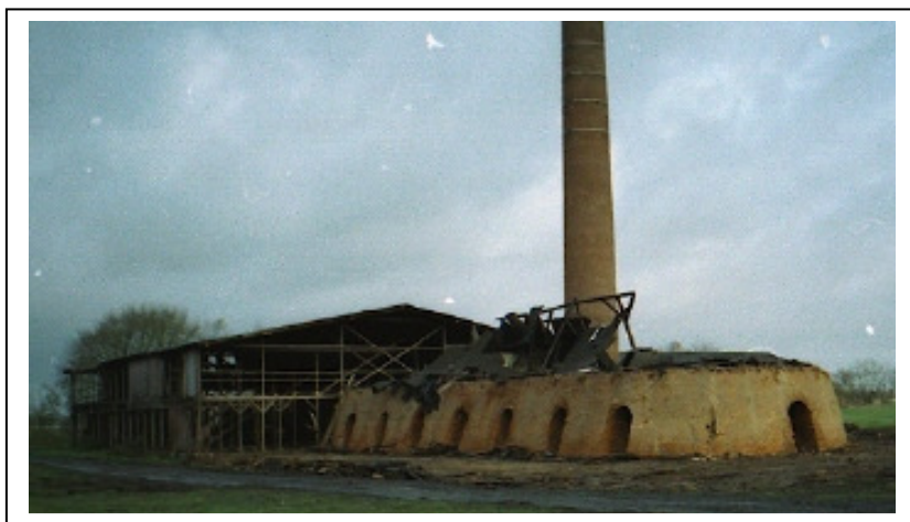
Red. Den blottede ringovn ved nedrivningen 2001

Der fulgte så nogle år med stor fabrikation, men samtidigt fulgte også en kolossal teknisk udvikling, hvilket medførte, at det gamle ringovnsteglværk med lufttørring og manuel betjening, ikke længere kunne klare sig i konkurrencen med de store og moderne tunnel-værker rundt omkring i landet.